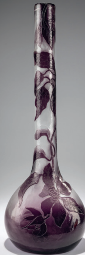
92 Emile Gallé, Nancy Marqueterie-Schale, um 1900

H. 9 cm. Überfangglas, farblos, schräg verzogene bernsteinbraune und violette Einschlüsse, feine Luftbläscheinschlüsse (Patinage). Mehrfarbige Marqueterie, Dekor mit Blüten.