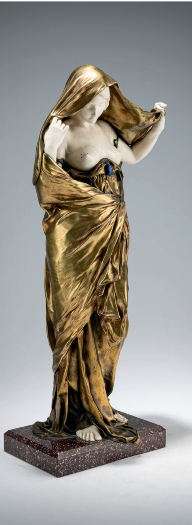
251 Louis-Ernest Barrias Chryselephantin-Figur 'La Nature se dévoilant à la Science', 1889

Antikisierende Frauenfigur mit entblößten Brüsten, die Natur personifizierend, ein Tuch von ihrem Kopf ziehend und sich damit „erkunden“ lassend. H. 40,5 cm; H. 43 cm (gesamt). Bronze, vergoldet, Lapis-Cabochon und grüner Schmuckstein. Kopf, Oberkörper, Arme und Füße aus geschnitztem Elfenbein. Saum des Gewandes sign.: EBarrias, Gießerstempel von Susse Frs. Edts. Paris (geprägt, teilw. undeutlich). Roter Marmorsockel. Entwurf 1889 für die Medizinische Fakultät in Bordeaux in Marmor. Ein zweites Exemplar stand auf der Prunktreppe des Konservatoriums für Kunst und Handwerk in Paris. Cadet, Susse Frères, Paris 1992, S. 52, S. 281 (Katalog von 1910). Eine EG-Bescheinigung des Referats für Klima- und Umweltschutz der Landeshauptstadt München liegt vor, die die Vermarktung von Objekten mit Elfenbein innerhalb der Europäischen Union zulässt. € 7.000 - 9.000