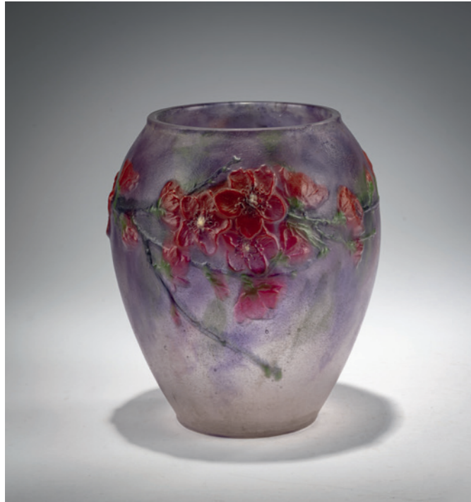
2 Gabriel Argy-Rousseau Vase 'Fleurs de Pêcher', 1920

H. 14 cm. Pâte de Verre, farblos, violett, dunkelgrün, dunkelrot und gelb. Sign.: G. Argy-Rousseau, FRANCE (vertieft). Bloch-Dermant, G. Argy-Rousseau, Paris 1990, Nr. 20.04. € 3.400 - 3.800