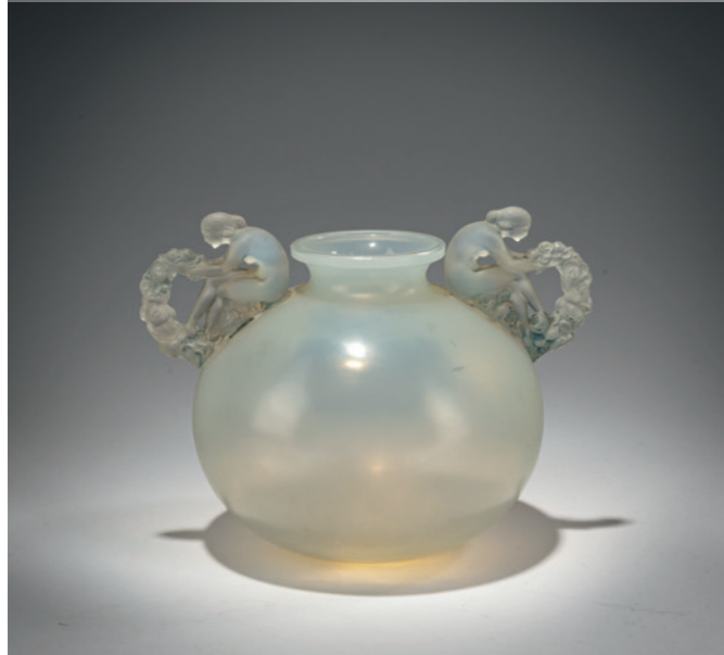
153 René Lalique Henkelvase 'Bouchardon', 1926

H. 19 cm. Ausführung: René Lalique, Wingen-sur-Moder. Farbloses Pressglas, grau patiniert. Sign.: LALIQUE (vertieft). Marcilhac, René Lalique, Paris 2011, Nr. 900. € 1.400 - 1.600