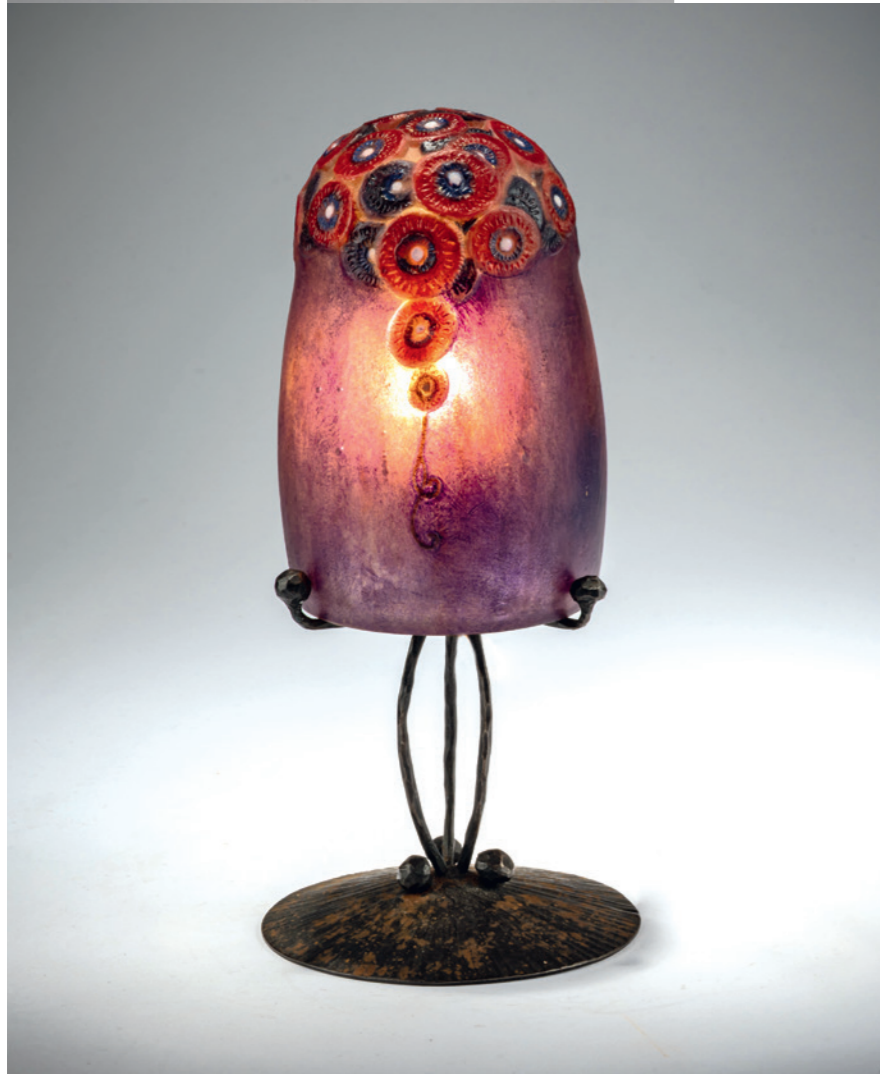
3 Gabriel Argy-Rousseau Tischleuchte 'Trois Trous', 1922

H. 14 cm. Pâte de Verre, farblos, violett, dunkelgrün, dunkelrot und gelb. Sign.: G. Argy-Rousseau, FRANCE (vertieft). Bloch-Dermant, G. Argy-Rousseau, Paris 1990, Nr. 20.04. € 3.400 - 3.800