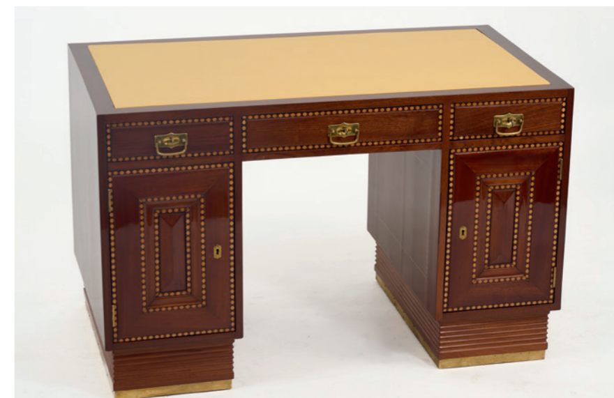
331 Adolf Loos (Umkreis) Schreibtisch, um 1900

H. 80,5 cm, 124,5 x 64,5 cm. Buchenholz, dunkelgraues Leder, verkupferte Messingbeschläge.