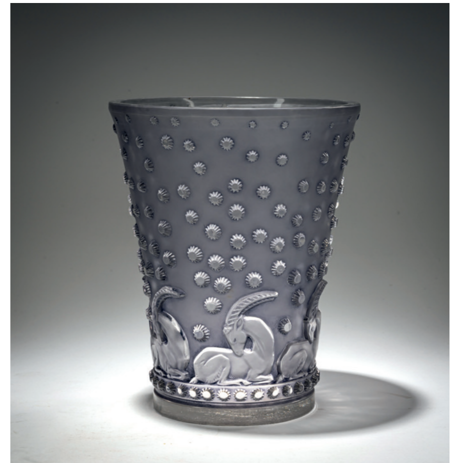
158 René Lalique Vase 'Ajaccio', 1938

L. 48 cm. Ausführung: René Lalique, Wingen-sur-Moder. Farbloses Pressglas, teilweise satiniert. Sign.: R. LALIQUE FRANCE (sandgestrahlt). Marcilhac, René Lalique, Paris 2011, Nr. 3461. € 1.800 - 2.200