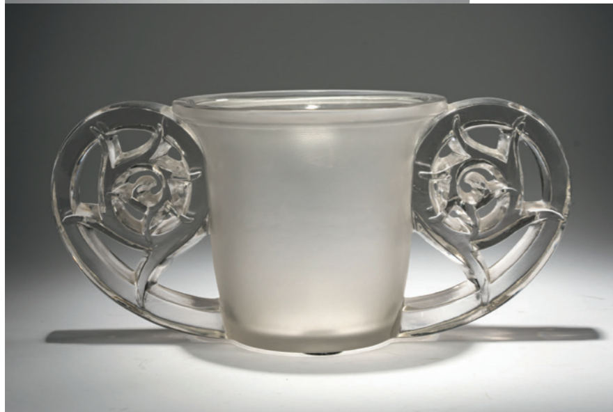
154 René Lalique Vase 'Pierrefonds', 1926