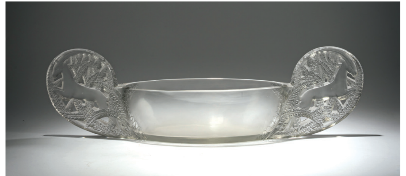
155 René Lalique Jardiniere 'Saint-Hubert', 1927

H. 15,2 cm. Ausführung: Lalique, Wingen-sur-Moder. Farbloses Pressglas, teilweise satiniert. Sign.: Lalique France (graviert). Marcilhac, René Lalique, Paris 2011, Nr. 990. € 1.600 - 2.000