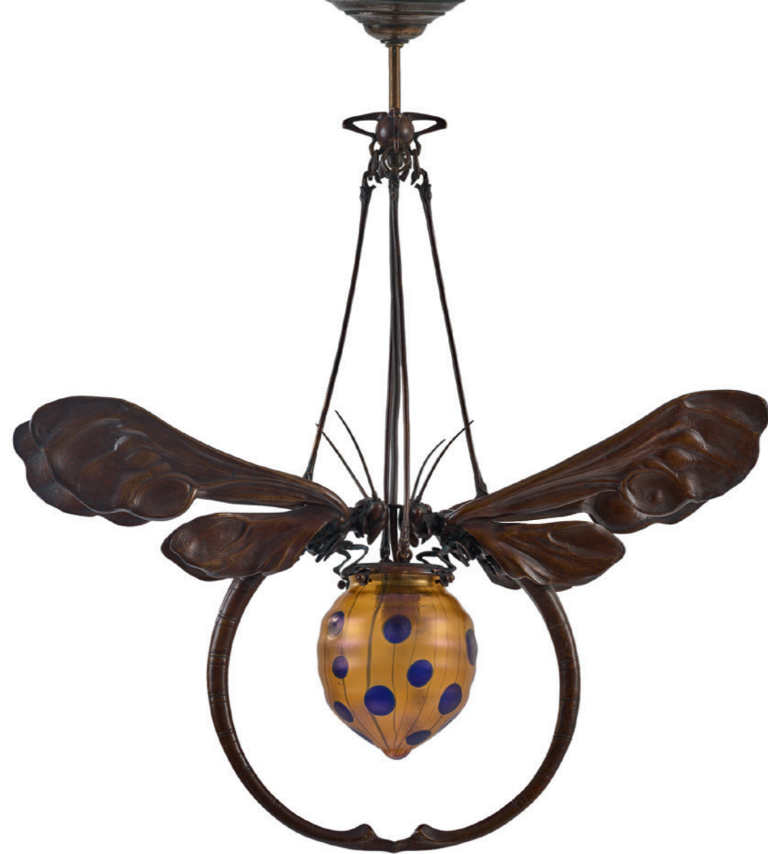
328 Koloman Moser Schule Deckenleuchte 'Libellen' mit Glasschirm 'Streifen und Flecken', um 1903

H. 69 cm, B. 58,5 cm. Bronze, dunkel patiniert. Schirm aus orangefarbenem Glas mit aufgeschmolzenen blauen Streifen und Flecken, stark gold- und perlmuttfarben mattlüstert.