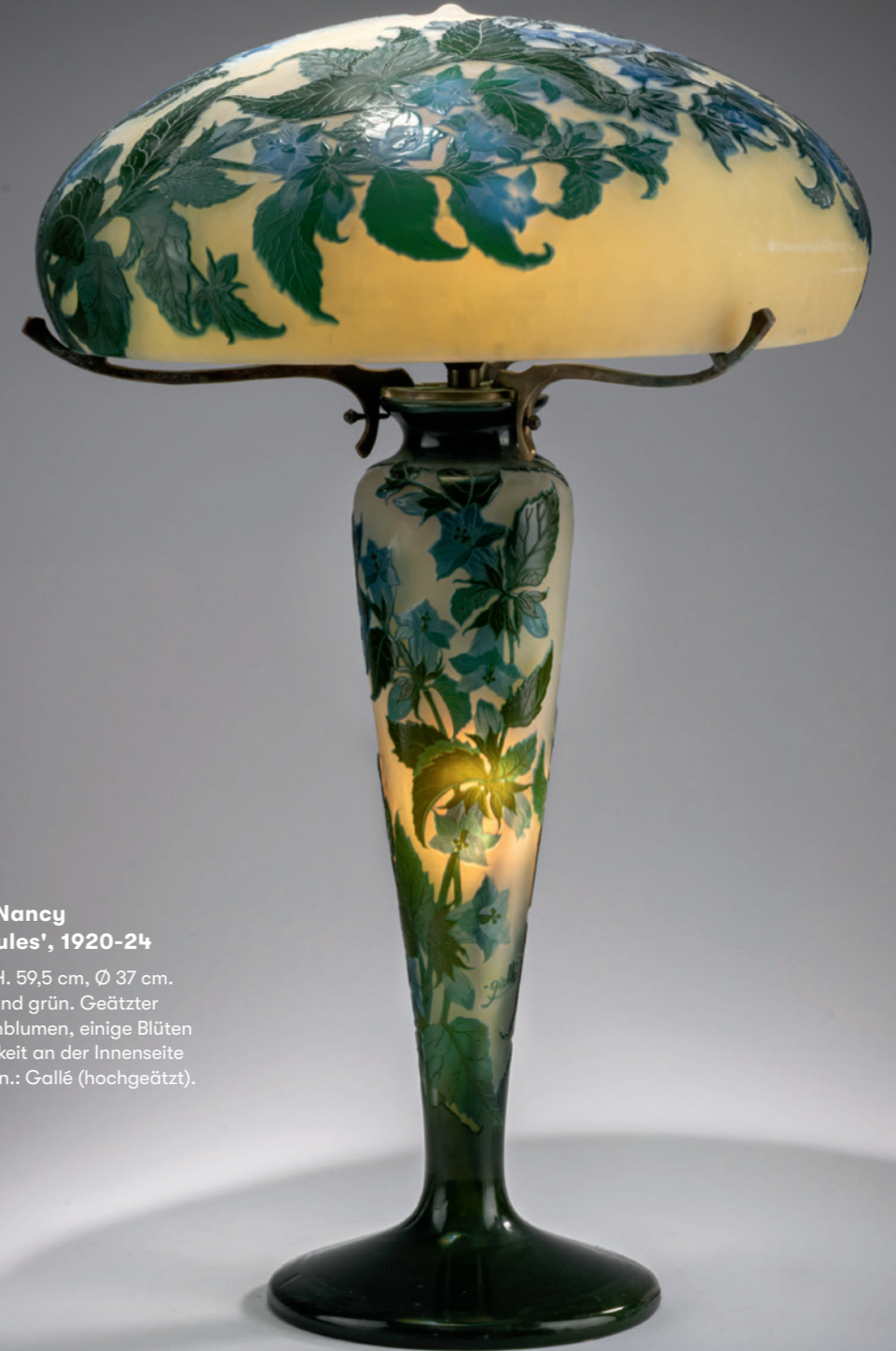
128 Etablissements Gallé, Nancy Tischleuchte 'Campanules', 1920-24

Pilzschirm über Balusterfuß. H. 59,5 cm, Ø 37 cm. Überfangglas, farblos, blau und grün. Geätzter Dekor mit blühenden Glockenblumen, einige Blüten zur Hervorhebung der Farbigkeit an der Innenseite geätzt. Schirm und Fuß je sign.: Gallé (hochgeätzt).