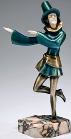
279 Roland Paris Chryselephantin-Figur 'Florettfechter' ('Pagliacci'), um 1925

H. 29,7 cm, H. 34,5 cm (gesamt). Bronze, kalt bemalt, Kopf und Hände aus geschnitztem Elfenbein, teilweise bemalt. Metall. Sockel sign.: ROLAND PARIS (graviert und schwarz berieben). Heller Onyxsockel