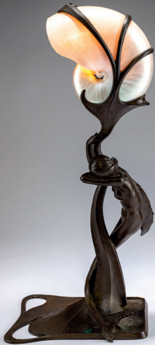
262 Gustav Gurschner Nautilus-Tischleuchte, 1899

Pflanzenartig-organischer Bronzefuß mit an den Schaft geklammerter Meerjungfrau mit Nautilus als Schirm. H. 44,5 cm. Bronze, dunkel patiniert. Stand sign.: GURSCHNER 7 99 (geprägt).