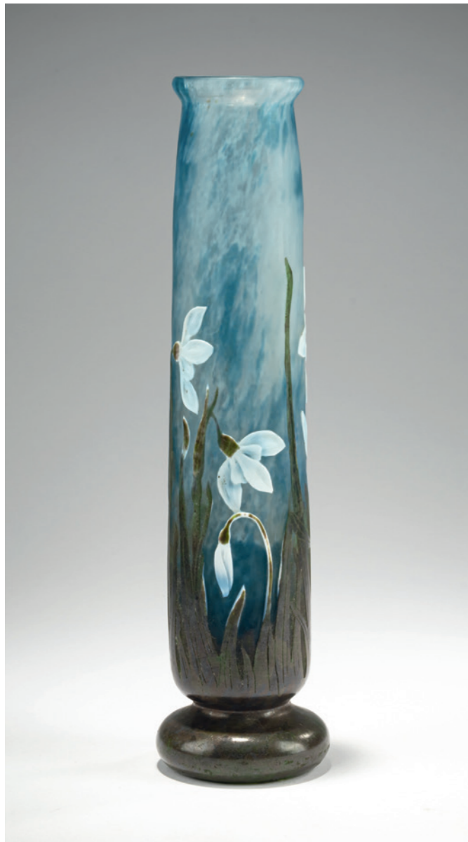
30 Henri Bergé Vase 'Anémones', um 1905

Gerader Korpus auf eingezogenem Fuß und leicht ausgestellter Mündung. H. 20,3 cm. Ausführung: Daum Frères, Nancy. Überfangglas, farblos, milchweiß und himbeerrot, rosafarbene und grüne Emailaufschmelzungen. Geätzter Dekor mit Anemonen, vier Blüten als partielle Auflagen, fein mit dem Rad graviert, 'Plaquettes gravées à la roue'. Grund im Marteléschliff. Boden sign.: DAUM, Lothringer Kreuz, NANCY (graviert).