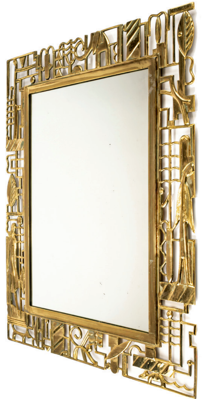
264 Werkstätte Hagenauer, Wien Wandspiegel, um 1928

Hochrechteckig. 59,5 x 47,5 cm. Messing, durchbrochener Dekor mit menschlichen und Tierfiguren sowie stilisierten Pflanzen, Spiegelglas, Holz. Bez.: HAGENAUER WIEN, wHw, MADE IN AUSTRIA (geprägt).