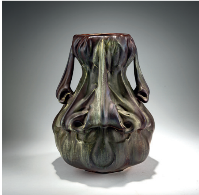
340 Keller & Guerin, Lunéville Henkelvase, um 1900

H. 29 cm. Steingut, matte Lüsterglasur in Violett und Grün. Nicht sign. Risse in den Henkeln. € 750 - 850