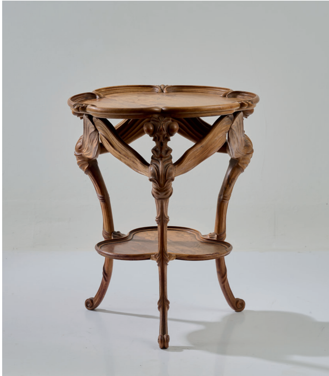
303 Emile Gallé Beistelltisch 'Libellules', 1900

Sechspassige, leicht gemuldete Tischplatte mit Seenlandschaft mit fliegender Libelle auf drei Füßen in Form von aufwendig geschnitzten, plastischen Libellen. Eingepasste zweite, dreipassige, Platte mit Seerosendekor. H. 77 cm, Ø 66 cm. Nussbaum, Marqueterie in unterschiedlichen Hölzern. Sign.: E. Gallé mit Lothringer Kreuz (intarsiert). Entwurf für die Weltausstellung in Paris 1900.