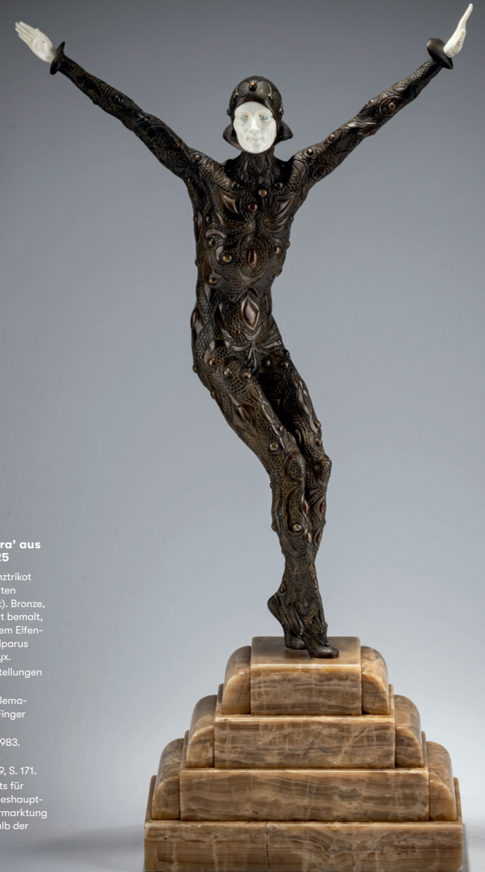
256 Demètre H. Chiparus Chryselephantin-Figur 'Astra' aus der Gruppe 'Finale', um 1925

Antikisierende Frauenfigur mit entblößten Brüsten, die Natur personifizierend, ein Tuch von ihrem Kopf ziehend und sich damit „erkunden“ lassend. H. 40,5 cm; H. 43 cm (gesamt). Bronze, vergoldet, Lapis-Cabochon und grüner Schmuckstein. Kopf, Oberkörper, Arme und Füße aus geschnitztem Elfenbein. Saum des Gewandes sign.: EBarrias, Gießerstempel von Susse Frs. Edts. Paris (geprägt, teilw. undeutlich). Roter Marmorsockel. Entwurf 1889 für die Medizinische Fakultät in Bordeaux in Marmor. Ein zweites Exemplar stand auf der Prunktreppe des Konservatoriums für Kunst und Handwerk in Paris. Cadet, Susse Frères, Paris 1992, S. 52, S. 281 (Katalog von 1910). Eine EG-Bescheinigung des Referats für Klima- und Umweltschutz der Landeshauptstadt München liegt vor, die die Vermarktung von Objekten mit Elfenbein innerhalb der Europäischen Union zulässt. € 7.000 - 9.000