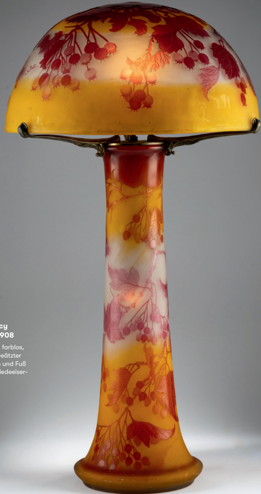
108 Etablissements Gallé, Nancy Tischleuchte 'Groseilles', 1908

H. 86 cm, Ø 48 cm. Überfangglas, farblos, bernsteinbraun und himbeerrot. Geätzter Dekor mit Johannisbeeren. Schirm und Fuß je sign.: Gallé (hochgeätzt). Schmiedeeiserne Montierung.