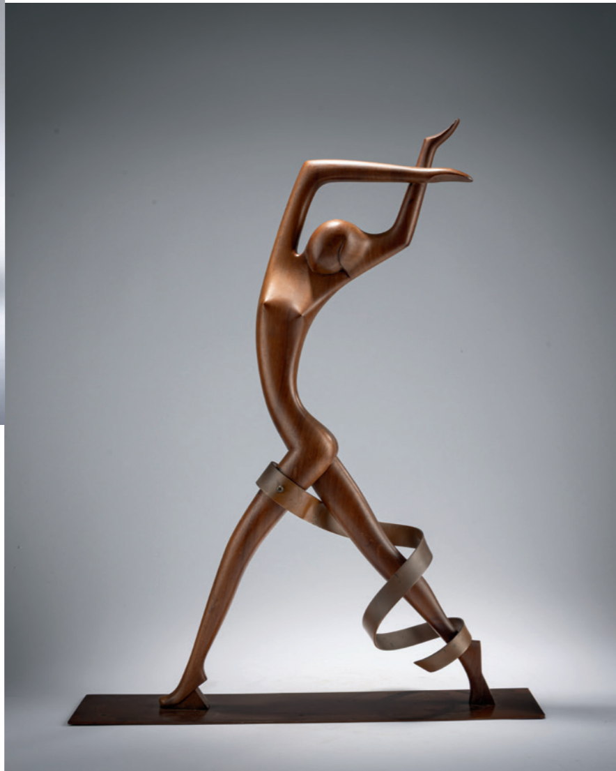
267 Werkstätten Hagenauer, Wien Holzfigur 'Schreitende' mit Band, nach 1945

H. 56 cm. Geschnitztes Holz, Messingband, Messing, verkupfert. Bez.: HAGENAUER WIEN wHw MADE IN AUSTRIA Handmade.