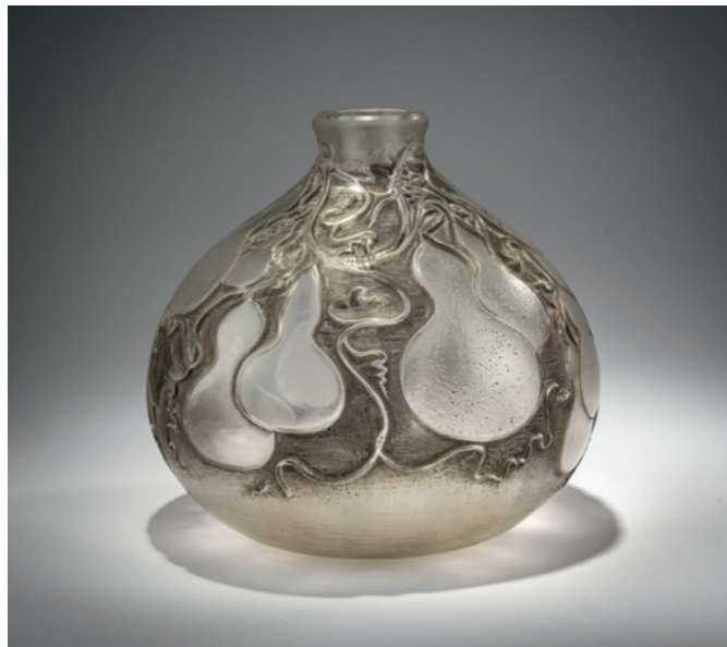
145 René Lalique Vase 'Courges', 1914

H. 19 cm. Ausführung: René Lalique, Wingen-sur-Moder. Farbloses Pressglas, grau patiniert. Sign.: LALIQUE (vertieft). Marcilhac, René Lalique, Paris 2011, Nr. 900. € 1.400 - 1.600