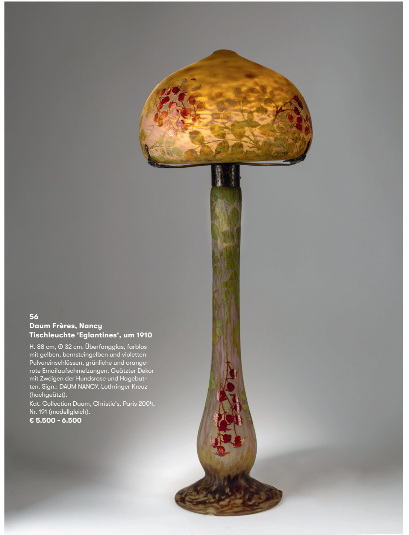
56 Daum Frères, Nancy Tischleuchte 'Eglantines', um 1910

H. 88 cm, Ø 32 cm. Überfangglas, farblos mit gelben, bernsteingelben und violetten Pulvereinschlüssen, grünliche und orangefarbene Emailaufschmelzungen. Geätzter Dekor mit Zweigen der Hundsrose und Hagebutten. Sign.: DAUM NANCY, Lothringer Kreuz (hochgeätzt).