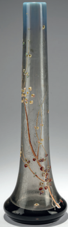
83 Emile Gallé, Nancy Enghalsvase 'Callicarpa japonica et cardères sauvages', um 1889

H. 32,5 cm. Zart rauchfarbenes Glas, im oberen Bereich leicht opaleszent. Geätzt, polychrom emailliert und goldgehöhnt. Dekor mit Kardendistel und Liebesperlenstrauch. Boden sign.: E. Gallé déposé mit Pflanze (camaieu-rot).