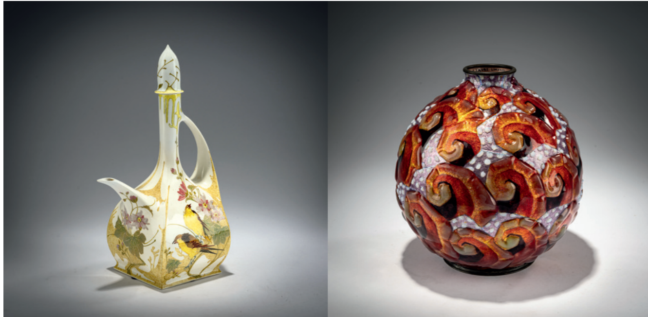
369 Johannes Cornelis Heijtzte (wohl) Kaffeekanne, wohl 1906

H. 25,5 cm. Eierschalenporzellan, polychrome Glasurmalerei mit Blumen und vier Vögeln. Sign.: Storchenmarke mit Krone (grauer Glasurstempel) Jahreszeichen, Fenster 550, Malersignatur (schwarz, handschriftlich), 159 (erhaben geprägt). Stopfen, Hals und Spitze der Tülle restauriert. € 2.000 - 2.200