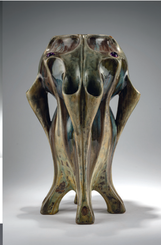
352 Joseph Mougin Hohe Vase auf vier Füßen, um 1900

H. 29 cm. Steingut, matte Lüsterglasur in Violett und Grün. Nicht sign. Risse in den Henkeln. € 750 - 850