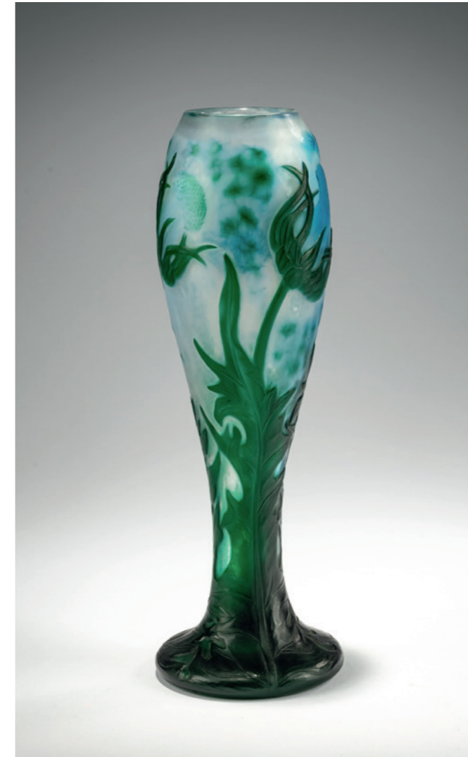
15 Daum Frères, Nancy Vase 'Chardons', um 1900

H. 23,7 cm. Überfangglas, farblos, blau und grün. Geätzter Dekor mit Disteln auf martelliertem Grund. Boden sign.: DAUM NANCY, Lothringer Kreuz (graviert). € 3.400 - 3.800