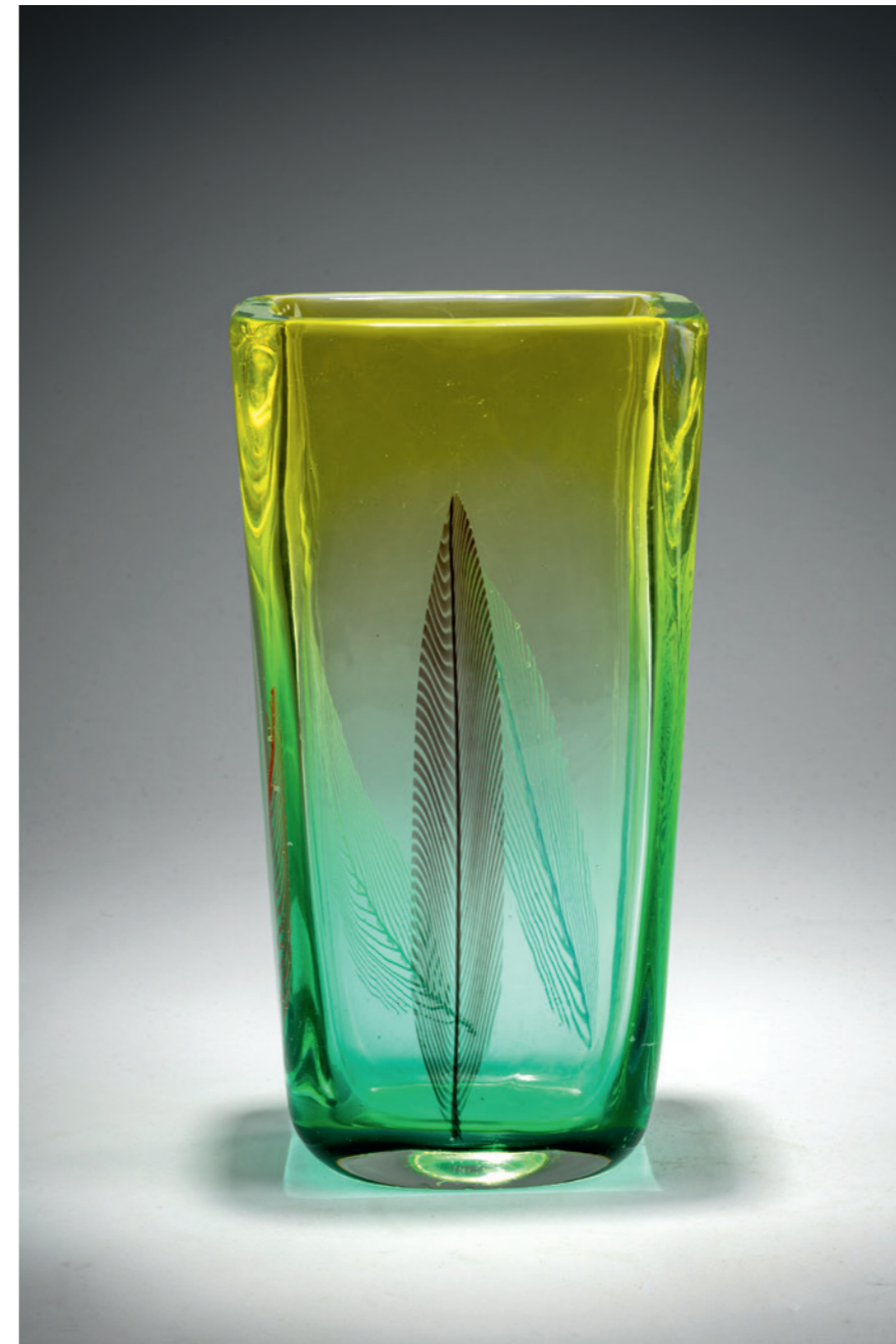
661 Archimede Seguso Vase 'A piume', 1955

H. 22,2 cm. Ausführung: Vetreria Archimede Seguso. Überfangglas, farblos und grün bis gelb verlaufend mit fünf eingeschmolzenen Federn in Weiß, Blau, Tiefviolett, Gelb und Rot.