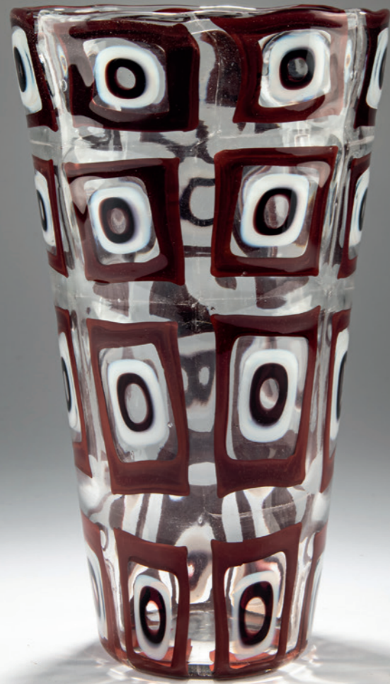
623 Ercole Barovier Vase 'Dorico corniola', 1965

Hohe Becherform. H. 29,5 cm. Ausführung: Barovier & Toso. Farbloses Glas mit aufgeschmolzenen großen, rechteckigen Murrinen aus farblosem Glas mit rostroten und milchweißen Ringen. Am Boden bez.: Ercole Barovier 9/10/65 (graviert).