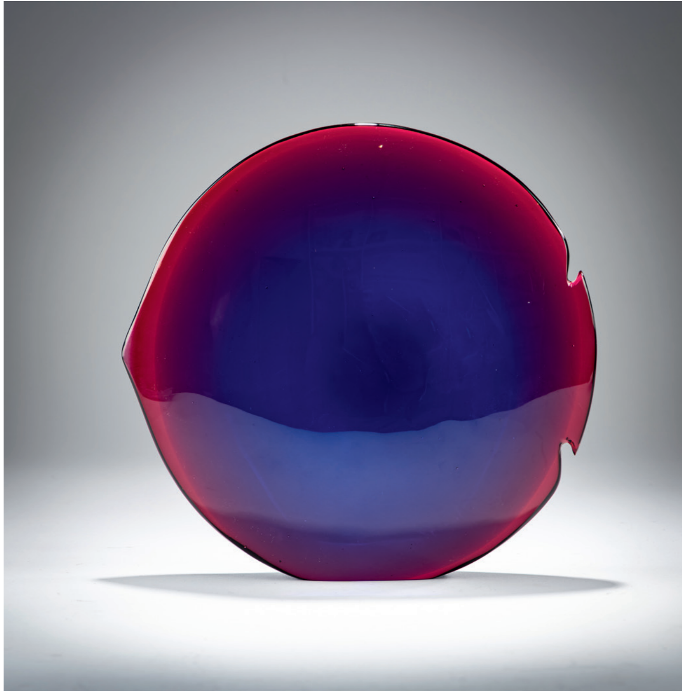
641 Flavio Poli Fisch 'Sommerso blu rubino', 1954

Modell-Nr. 9813, für die X. Triennale, Mailand 1954. H. 23,5 cm. Ausführung: Seguso s.r.l. Überfangglas, farblos, rosafarben und dunkelblau. Boden bez.: Veronese Seguso Murano (graviert).