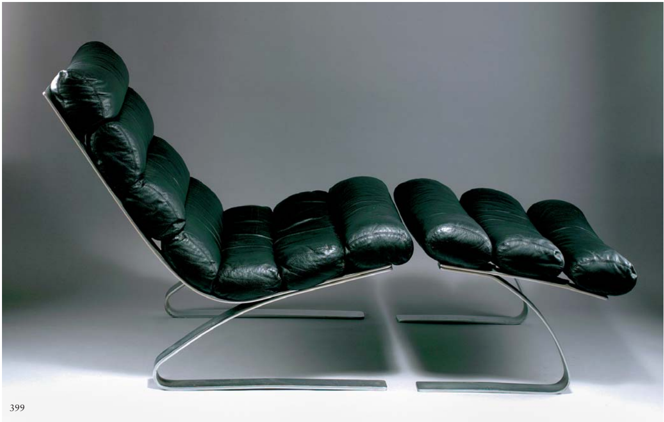
399 REINHOLD ADOLF; HANS-JURGEN SCHROPPER 'Sinus'-Sessel mit Ottoman Entwurf: 1976. Sessel: H. 86 x 73 x 100 cm; Ottoman: H. 47 x 73 x 60 cm. Ausführung: Cor, Rheda-Wiedenbrück. Bandstahl matt verchromt; Polsterung mit schwarzem Lederbezug. Cor , S. 50, 56f. US $ 4.200,- · EUR 3.000,-