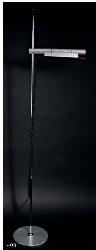
400 ROSEMARIE UND RICO BALTENSWEILER Stehleuchte 'Halo 250' mit magnetischem Tastdimmer 'Silentio' Entwurf: 1976. H. 192 cm. Ausführung: Baltensweiler AG, Ebikon. Stahlrohr, verchromt, Reflektor aus Aluminium. Dimmer bez.: BALTENSWEILER SILENTIO, www.baltensweiler.ch, made in switzerland. Mobilier Suisse , S. 131. US $ 1.260,- · EUR 900,-